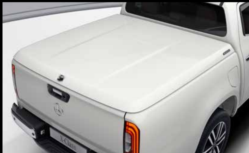
Palllok 305.000 kr.- (efni og vinna)