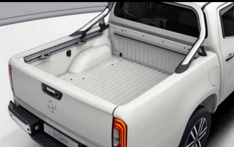
Krómgrind á pall 130.000 kr.- (efni og vinna)