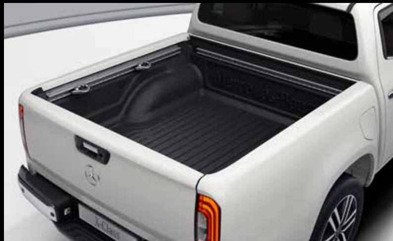
Heithúðun á palli 105.000 kr.- (efni og vinna)