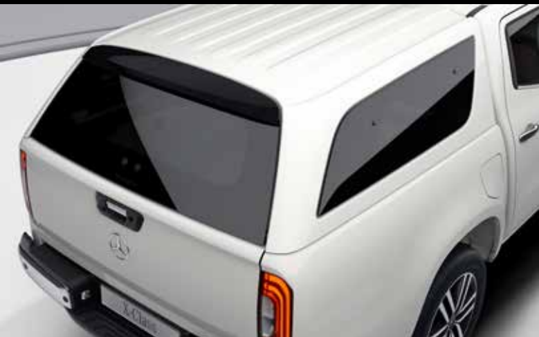
Pallhús 790.000 kr.- (efni og vinna)