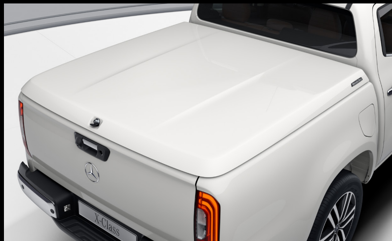
Palllok 305.000 kr.