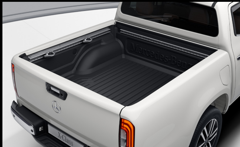
Heithúðun á palli 105.000 kr.