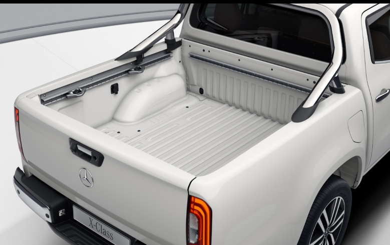
Krómgrind á pall 130.000 kr.