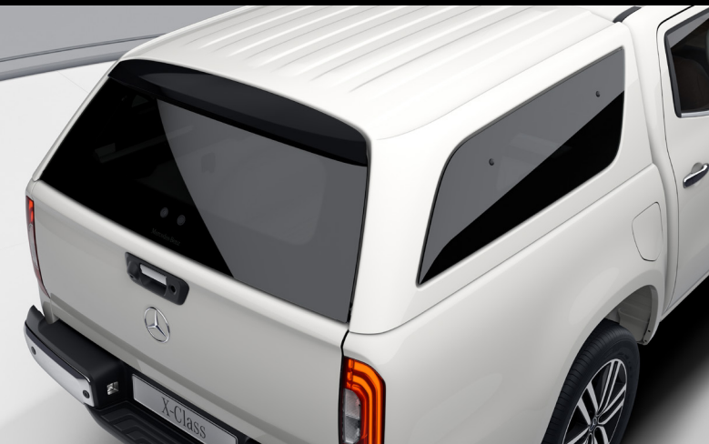
Pallhús 790.000 kr.